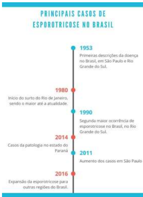
Figura 2 - Fluxograma com os principais eventos ocorridos no Brasil, usando os dados de Sales, 2021.

No início do século XX, a esporotricose predominava em dois países: EUA e França. O primeiro surto da doença ocorreu na África do Sul, entre 1941 e 1944, com 3000 mineradores infectados. Posteriormente, houve outro surto em Mississippi (EUA). Conforme o fluxograma apresentado na figura 2, os surtos no Brasil iniciaram em São Paulo, decorrente da contaminação através do solo no ano de 1953, havendo 235 casos humanos confirmados e no Rio Grande do Sul, com 646 casos. Sendo a espécie S. brasiliensis o responsável por causar 90% dos casos no Brasil (Sales, 2021).